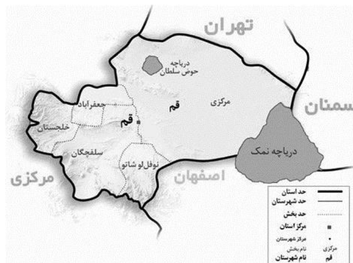
شکل: موقعیت بخش جعفرآباد، استان قم

جعفرآباد یکی از بخش‌های استان قم بوده که مرکز آن شهر جعفریه در ۳۵ کیلومتری شمال غربی قم است. جمعیت این شهر برابر با ۷۲۰۳ نفر می‌باشد. این بخش دارای آب و هوای گرم و خشک و در مسیر راه ارتباطی استان‌های غربی و مرکزی کشور قرار دارد (شکل).