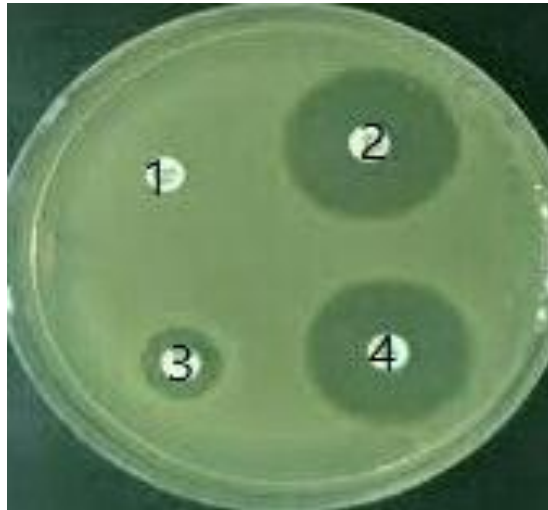
شکل شماره ۱: تأیید فنوتیپی جدایه‌های سودوموناس آئروژینوزا مولد بتالاکتامازهای وسیع‌الطیف. (۱) دیسک سفتازیدیم، (۲) دیسک ترکیبی سفتازیدیم و کلوالانیک اسید، (۳) دیسک سفوتاکسیم، (۴) دیسک ترکیبی سفوتاکسیم و کلوالانیک اسید.

از ۱۱۷ جدایه سودوموناس آئروژینوزا، ۲۷ جدایه (۲۳٪)؛ مقاومت دارویی چندگانه (MDR) به سه کلاس آنتی‌بیوتیکی نشان دادند. این مقاومت‌ها نسبت به آنتی‌بیوتیک‌های آزرئونام (از کلاس مونوباکتام‌ها)، ایمی‌پنم (از کلاس کریپانم‌ها)،