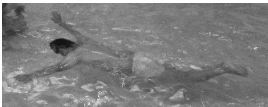
شکل شماره ۲: حرکت شناوری ستاره دریایی