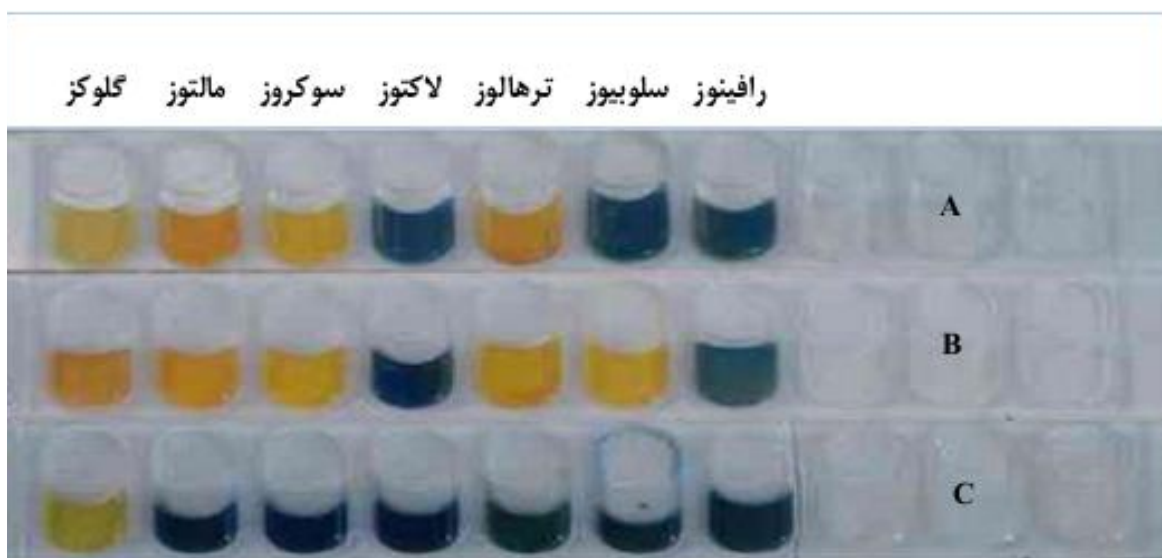
شکل: نوار رنگی جهت تشخیص گونه‌های کاندیدا با استفاده از کیت API20C. A: کاندیدا آلیکنس؛ B: کاندیدا تروپیکالیس؛ C: کاندیدا کروژنی.

دیسک‌های ضدقارچی آمفوتریسین B، فلوکونازول، کتوکونازول، نیستاتین، ایتروکونازول و کاسپوفانژین از شرکت پادتن طب ایران خریداری گردید. آزمایش آنتی‌بیوگرام نیز با استفاده از روش استاندارد دیسک دیفیوژن برای ۸۳ نمونه مثبت انجام شد. تست‌ها بر روی محیط مولر هینتون آگار که به وسیله سوسپانسیون قارچ (برابر با ۰/۵ مک‌فارلند) تلقیح شده بود، انجام گرفت. پلیت‌ها در دمای ۳۰ درجه سانتیگراد به مدت ۲۴ ساعت گرماگذاری شدند و قطر هاله‌ها (با توجه به جدول کارخانه سازنده دیسک‌ها) مورد تفسیر قرار گرفت (۱۴).